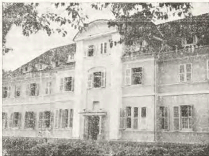
A fachada do Hospital Arquidiocesano, em 1936, criado com a instituição da “Santa Casa”.